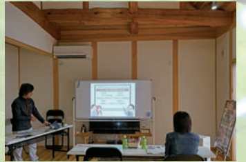
大事なことは目に見えない 家づくりは見えないことが大事です

勉強会では「後悔しない家づくり」に必要な知識をわかりやすくお伝えします。始めたばかりの方、注文住宅は高そうだから建売やマンションをお考えの方など、ぜひお気軽にご参加下さい。